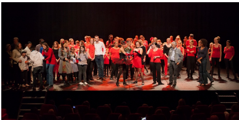
Salut final rassemblant les danseuses, danseurs, familles et enfants d'EAVO