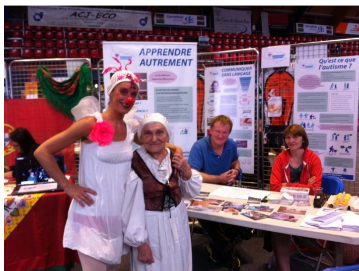
Stand d'EAVO au Forum des associations de Saint-Brice

L'association a également tenu un stand lors du Forum des Associations de Saint-Brice-sous-Forêt, en septembre 2013, au complexe sportif Lionel Terray.