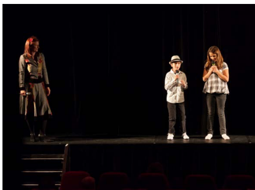
Introduction du spectacle par les enfants d'EAVO