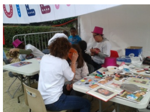
Les enfants d'EAVO à la Fête de la musique 2013

Les enfants (autistes ou frères et sœurs « neurotypiques ») qui participent régulièrement à ce groupe de jeu ont appris à interagir ensemble, et les relations qu'ils ont établies se prolongent dans la vie de tous les jours, d'autant que plusieurs d'entre eux (essentiellement les Saint-Briciens) sont amenés à fréquenter les mêmes lieux (écoles, centre de loisirs, conservatoire, événements municipaux...).