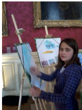
Les enfants d'EAVO au musée Jacquemart-André

Grâce à l'association EMLA, les enfants d'EAVO ont reçu pour Noël une tablette numérique.