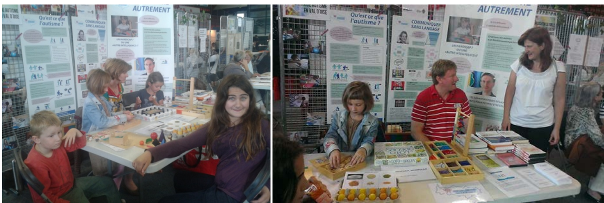
Stand d'EAVO au Forum des associations de Saint-Brice

L'association a tenu un stand lors du Forum des Associations de Saint-Brice-sous-Forêt, en septembre 2014, au complexe sportif Lionel Terray.